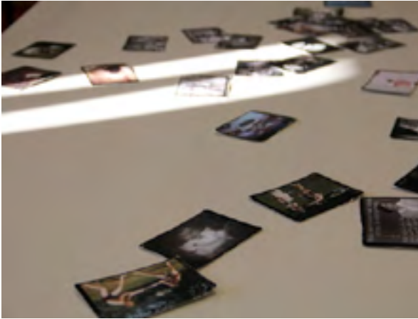
Table Mashup - découverte